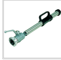
فوهة رغوة بقطر 2 بوصة