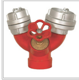
وصلة خدمة إطفاء الحرائق 4 بوصة - 2 بوصة