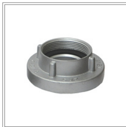
محول الخيط الداخلي والخارجي