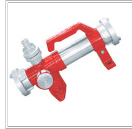
خلاط / موزع