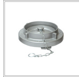
غطاء ألمنيوم مزود بسلسلة