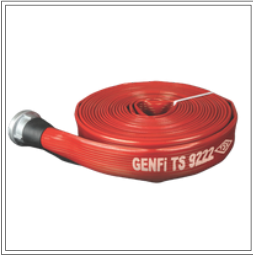
خرطوم قماشي مغطى بالمطاط