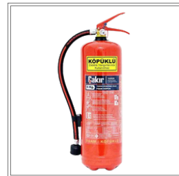
طفاية حريق بوردرة ABC MOP 40 بسعة 6 كجم