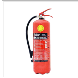
طفاية رغوة 6 كجم