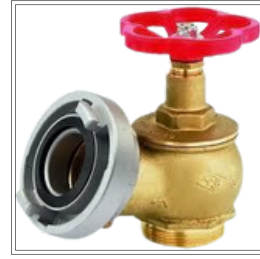
صمام كروي DN 52 "PN 16 - 2