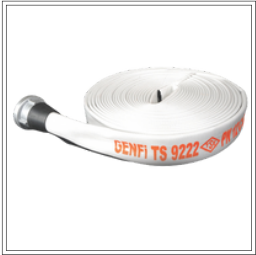
خرطوم من القماش