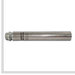
فوهة رغوة بقياس 1 بوصة