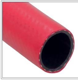
خرطوم مطاطي شبه صلب بقياس 1 بوصة