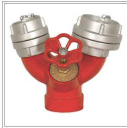
وصلة حريق 4 بوصة - 2 بوصة