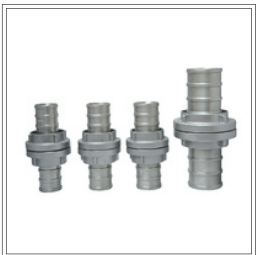
وصلة خرطوم مصنوعة من الألمنيوم