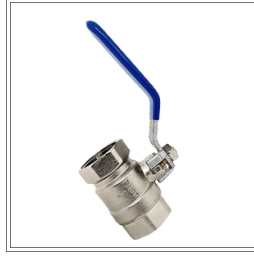
صمام كروي DN 25 "PN 25 - 1