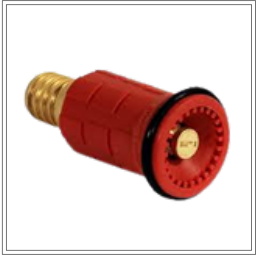
فوهة الضباب DN 25